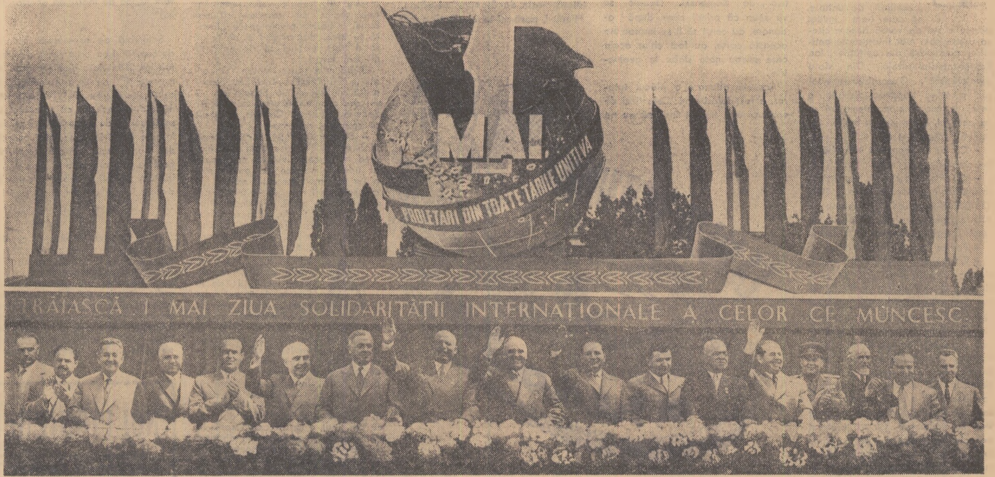
TRIBUNA CENTRALĂ ÎN TIMPUL DEMONSTRAȚIEI OAMENILOR MUNCII DIN CAPITALĂ

De 1 Mai, în întreaga țară, poporul muncitor și-a manifestat dragostea față de partid și guvern, hotărîrea de a obține noi succese în opera de construcție socialistă.