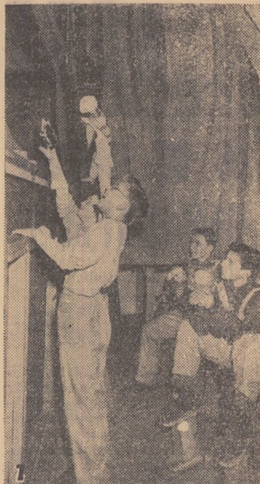
Sîntem la teatrul casei pionierilor „Julius Fucik” din Praga. (foto 1) Nu vedem fețele aprinse ale spectatorilor, dar în schimb primim în culise. Tinerii artiști și păpușile lor creează bucurii de neuitat pentru micii spectatori.

Oare omul învață numai pe băncile școlii? Da de unde! Cîte lucruri noi și folositoare au învățat copiii în cercurile de specialitate, ale caselor pionieresti! Unul dintre cercurile linierilor tehnicieni, ale casei pionierului din Opava, se ocupă de o bucată de lemn, (foto 2). Ce va deveni aceasta cîndva? Una dintre jucăriile pe care pionierii le fac pentru „colegii” lor mai mici din grădinițe.