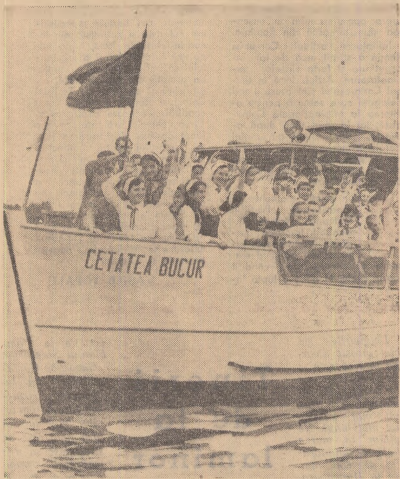
Bucuria orelor libere se citește pe chipurile pionierilor de la Școala de 7 ani nr. 26 din București. Ce bine-i să te plimbi cu vaporeșul pe lac!

Bun! Dar nu asta este nou-talca. Pentru că, elevi în clasa a VII-a, foarte buni la învățătură sînt foarte mulți în