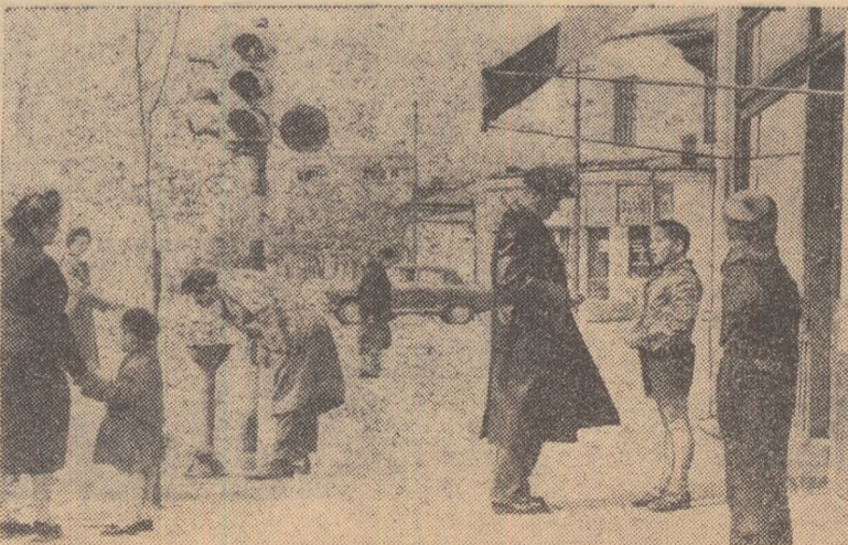
Unitatea de pionieri de la Școala medie „I. L. Caragiale” din București, a luat o hotărîre: „Să ne îngrijim de curățenia străzii, să nu mai fie nici un bilețel de tramvai pe jos”. Iată-i pe cițiva pionieri din detașamentul clasei a IV-a. Au și trecut la fapte.