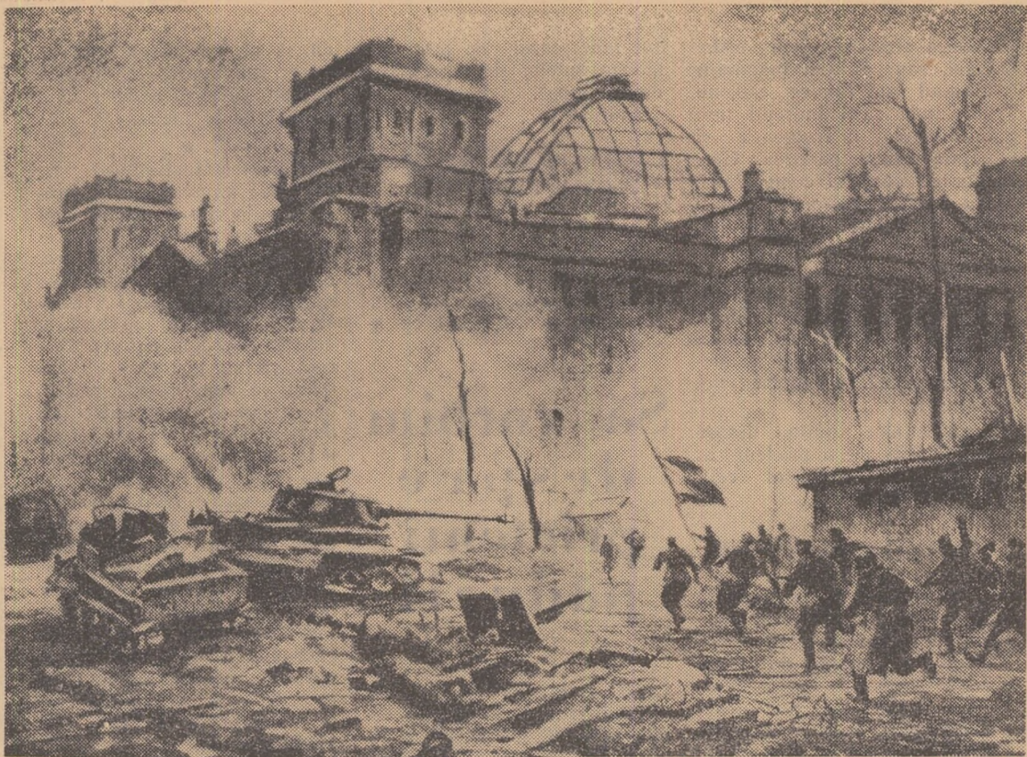
ASALTUL ASUPRA REICHSTAG-ULUI