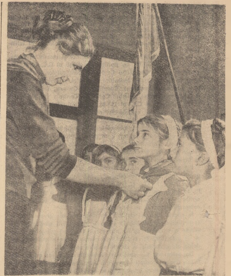
Un moment emoționant — primirea cravatei roșii.