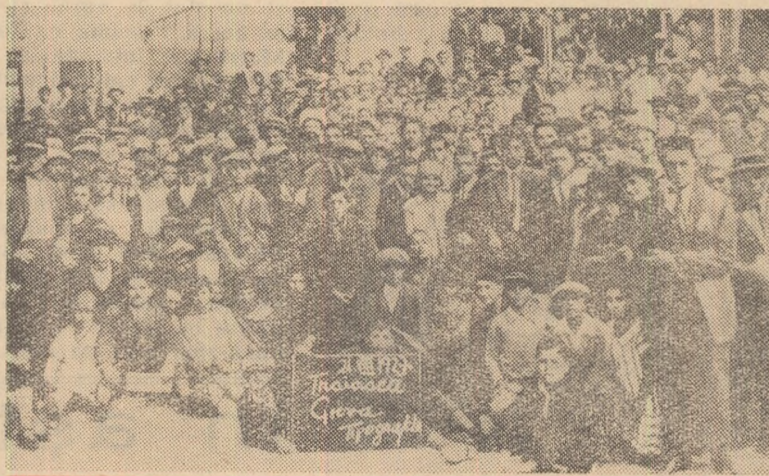
Participanți la greva tipografilor din august 1927.

Globul acesta simbolizând Marea Revoluție Socialiste din 1917, a fost lucrat din lemn de un grup de comuniști interni din Doftana.