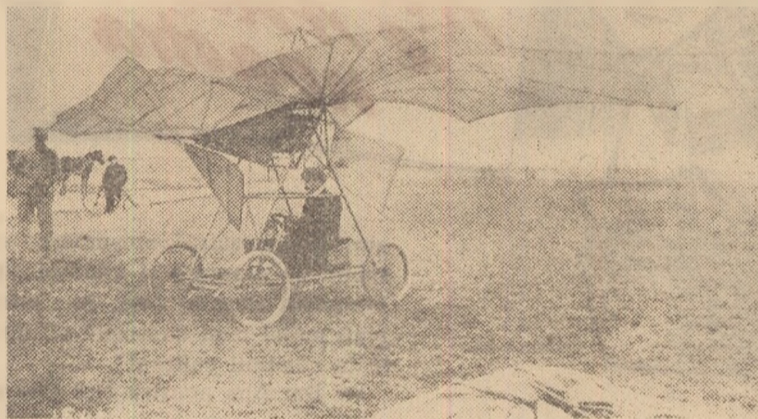
Avionul cu care Traian Vuia a efectuat primul lui zbor pe cîmpul de la Montesson.

De când năzuiește omul să zboare? Nimeni nu poate stabili cu precizie data cînd s-a născut această dorință; dar că ea