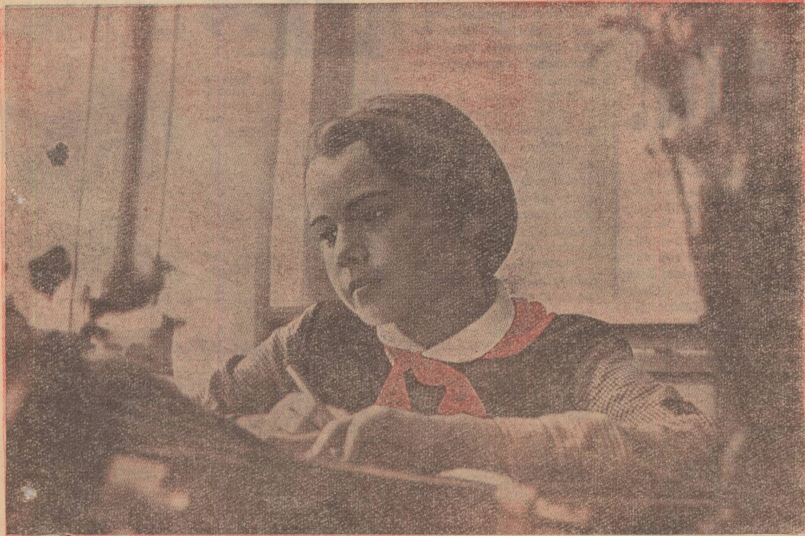
Liniște! Să n-o deranjăm — ea își pregătește lecțiile...