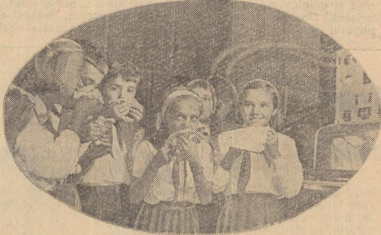
Grozav de bună este înghețata!

transformat în brînză, iaurt și... O să mai vedeți, să mergem acolo!