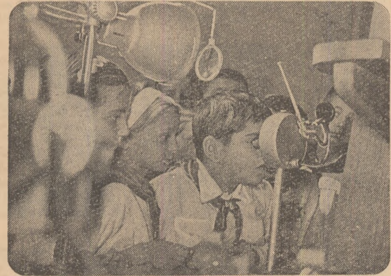
Cit de interesante sînt cercetările în laborator!