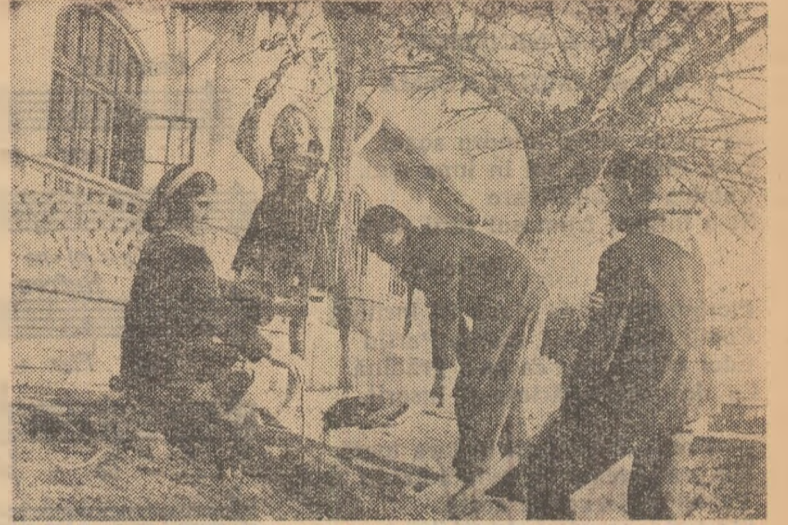
Pionierii de la Școala de 7 ani din comuna Comana, regiunea București, participă cu entuziasm la acțiunea de plantare a puietilor. Iată-i la lucru în curtea școlii

Peste puțin timp, harnicii pionieri și școlari au ridicat moviște proaspete de pămînt în jurul copăceilor, au pregătit sute de puietii de pomi fructiferi, puietii de salcimi și castani pentru iernare.