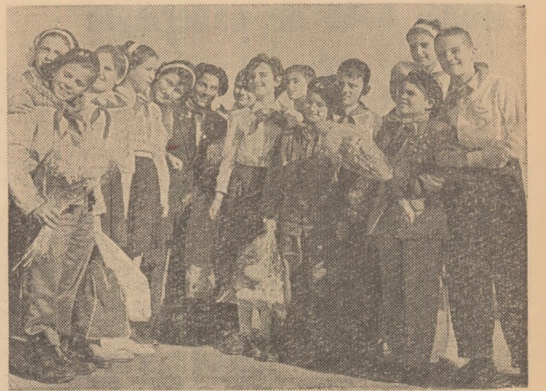
În București a sosit, la invitația C.C. al U.T.M., o delegație de copii din Cuba printre care se află și fiul premierului Fidel Castro. În fotografie: la sosirea delegației pe aeroportul Băneasa.

Lupta comuniștilor pentru unitatea de acțiune a tuturor forțelor democratice a și obținut un prim succes. S-a creat „Junta patriotică” în care sînt reprezentate toate curentele și care are în întreaga țară comitete de acțiune, precum și un ziar care apare în ilegalitate. Deși sprijinit de aliații săi atlantici, regimul Salazar este condamnat. Poporul portughez privește cu încredere viitorul.