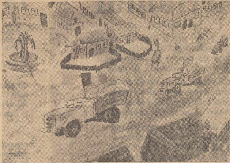
Recolta bogată în G.A.C.

Școala de 8 ani, comuna Ardeoani, regiunea Bacău.