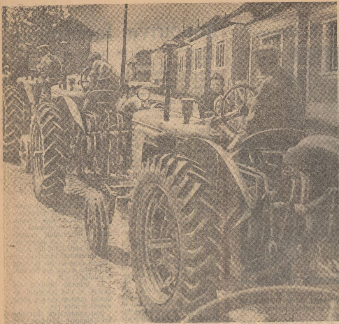
Tot mai multe sînt tractoarele care, ieșind pe porțile uzinei brașovene, iau drumul agriculturii, drumul nesfîrșitelor ogoare ale gospodăriilor agricole colective.