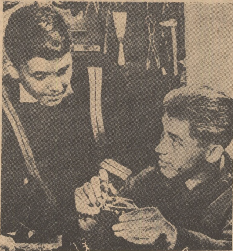
La clubul muncitoresc al Uzinei de locomotive și vagoane din Budapesta vin adesea foarte mulți copii. Fii ai muncitorilor din uzină, copiii au la dispoziție tot ce le trebuie pentru a desfășura o activitate plăcută, educativă.

Cît privește fostul „cartier al barăcilor” de altădată, a dispărut. Locul cocioabelor l-au luat blocuri moderne, elegante, iar cei mici, la fel ca mulți co-