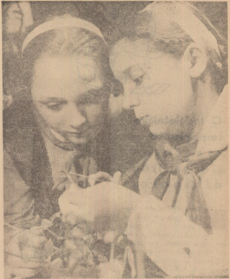
La Casa pionierilor din Ploiești, în cadrul cercului micilor naturaliști, se efectuează experiențe interesante, prin care pionierii își însușesc învățăminte prețioase.

Anul acesta, clasa a V-a studiază istoria antică. Pionierii au hotărît vizitarea în colectiv a muzeului de istorie veche. Acolo au văzut, printre altele, descoperiri aparținînd vremurilor foarte îndepărtate, pe teritoriul actualii regiuni Banat și al