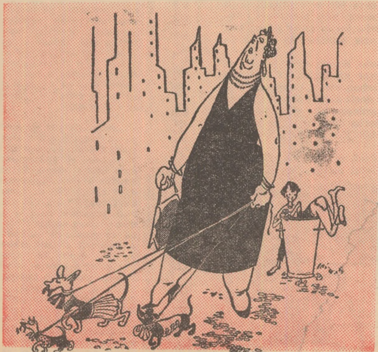
Desen: V. VASILIU

Niște doamne simandicoase din „lumea bună” a occidentalului au fost cuprinse subit de profunde griji și sentimente materne pentru soarta unor ființe ce se află în preajma lor. Să nu credeți cumva că se gîndeau la milioanele de șomeri care trăiesc în cea mai neagră mizerie. Nu. Se gîndeau la alte ființe, după părerea lor mult mai oropsite decît copiii șomerilor bunăoară, și anume, la bietețe patrupede din neamul cîinesc și pisicesc ce și-au găsit sălaş pe lângă casele lor. Drept pentru care, în multe țări ale lumii capitaliste, soarta cîinilor și a pisicilor de „neam boieresc” îl preocupă în cel mai înalt grad pe domnii capitaliști. Că lucrurile stau astfel, ne-o dovedesc numeroase știri publicate în revistele și ziarurile burghize sau transmise de agențiile de presă din occident. Bunăoară, din revista franceză „Paris Match” aflăm că în noaptea Anului nou, cîinii milionarilor englezi au petrecut în toată legea. Un Moș Gerilă