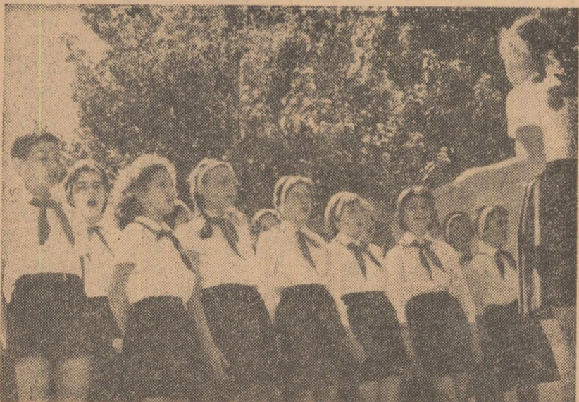
Copiii cîntă. E doar serbarea de sfîrșit de an. Școala de 8 ani nr. 19 din Capitală.