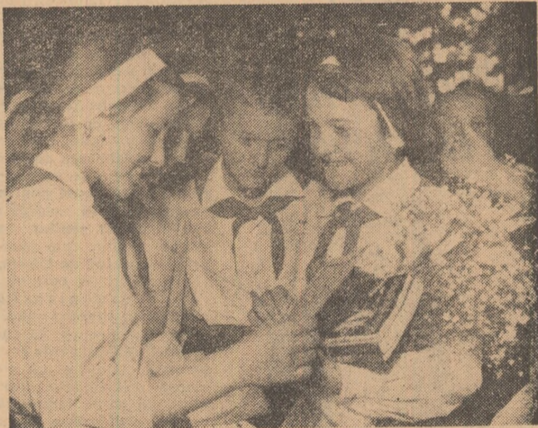
Moment solemn: la Școala de 8 ani nr. 171 din București — înminarea premiilor.

Îl felicit și eu, deși de mult nu mai sînt școlar.