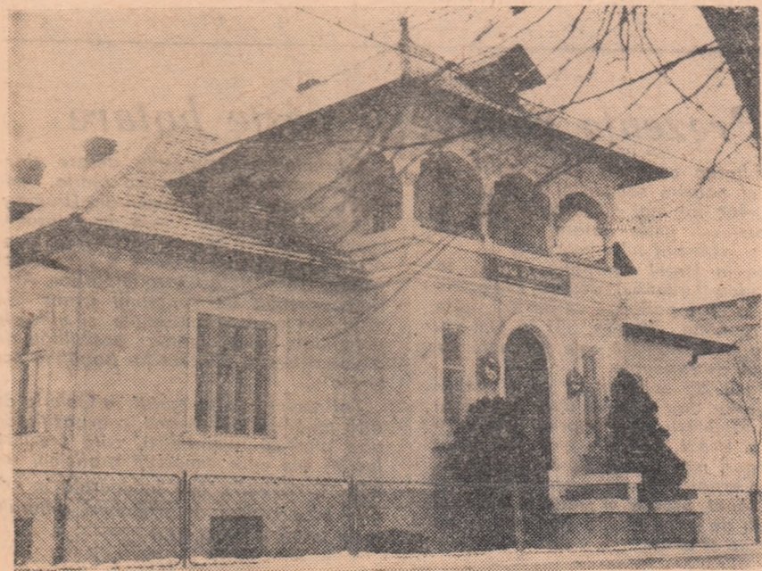
Casa pionierilor din Făgăraș

...In anul 1249, cînd marile orașe italiene erau independente, un soldat al orașului Bologna a trecut în armata orașului Modena, luînd cu el un hîrdău de stejar din care dădea apă caldului? Autoritățile de la Bologna nu au făcut mare caz de plecarea ostașului, în schimb țineau mult să fie restituit hîrdăul. Conducătorii de la Modena au refuzat această pretenție și s-a iscat o ceartă între cele două orașe, iar apoi un război, care a durat 22 de ani. Hîrdăul cu pricina se află și acum la Modena, într-unul din vechile turnuri ale orașului.