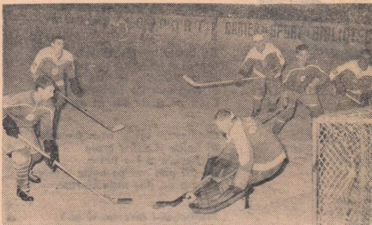
Aspecte de la întâlnirea dintre echipele de juniori Constructorul București—Avîntul Miercurea Ciuc.