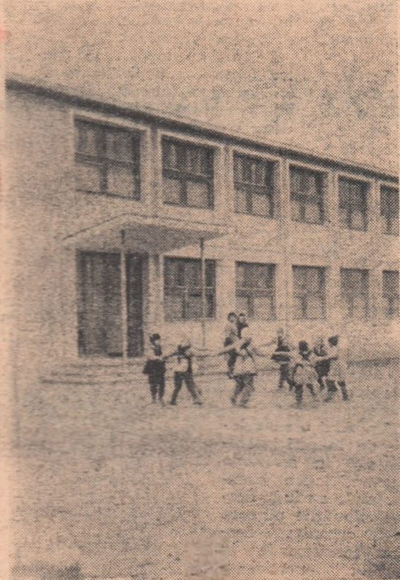
În centrul comunei Mărășești-Panciu, nu departe de Sfatul popular se află o clădire nouă, din curtea căreia glasurile vesele ale copiilor se aud pînă departe. E clădirea noulor școli generale de 3 ani, pe care o vedeți în fotografia de sus.

Pe strada largă circulează zeci de troleibuze (construite în țară) tramvaie și mașini de tot felul.