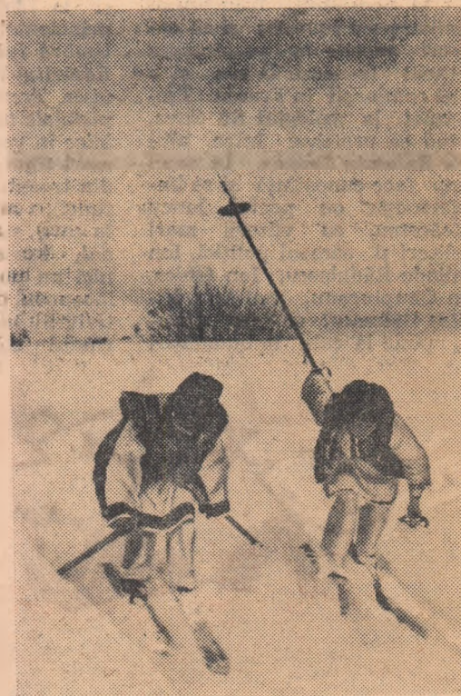
Cu schiuri pe dealurile comunei Ciocănești, raionul V. Dornei.