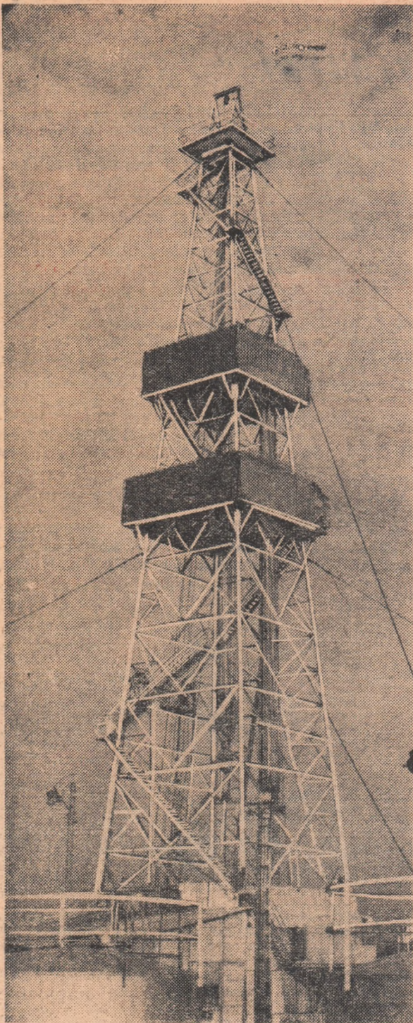
O puternică instalație de foraj fabricată de hărnicia și talentul constructorilor de utilaj petrolier din Ploiești.