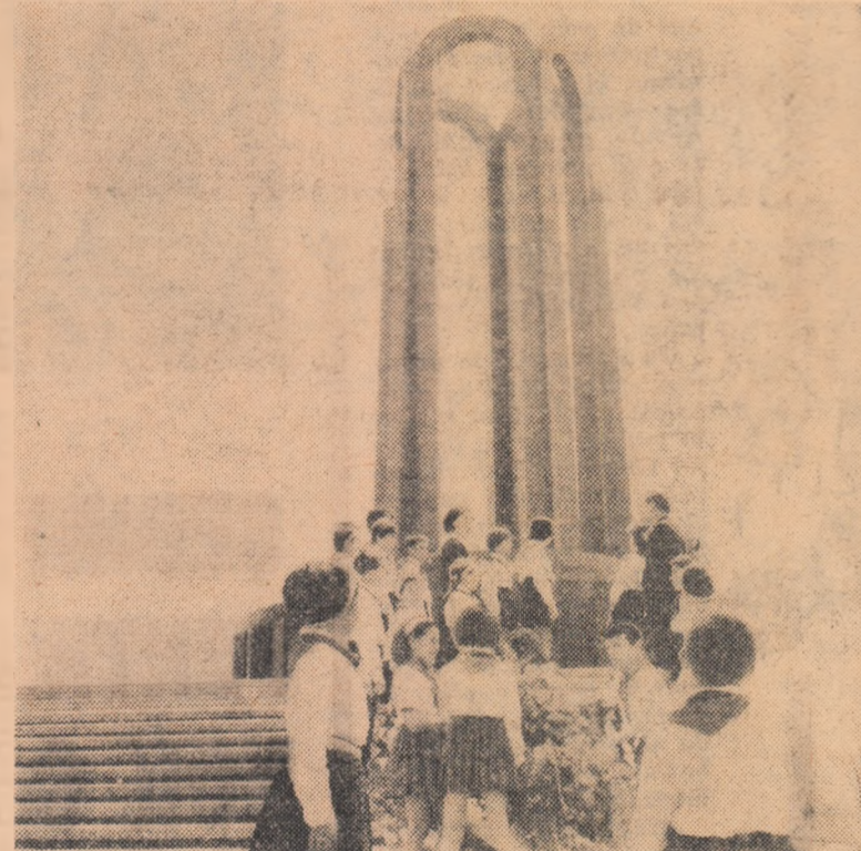
La Monumentul eroilor luptei pentru libertatea poporului și a patriei...