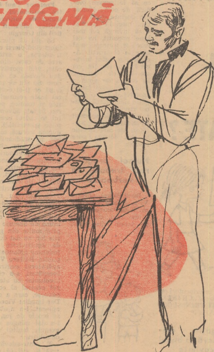
Desene : Puiu MANU

Cu timpul — că miile de kilometri de cablu nu se trag peste noapte — și lucrînd mai ales zi de zi, împreună — că așa se „fură“ meseria, lucrînd — l-am cunoscut și eu pe „maior“, altfel decât îi plăcea uneori să se arate... Adică am înțeles, cum s-ar spune, că nu citește nimeni ușor și nici nu răspunde cît ai bate din palme la două duzini de scrisori, mai ales cînd, în fiecare din ele, cum îmi spunea „maioru“, sînt bucurii, sînt necazuri și încă o mie de alte „circuite“ ascunse, dar care la fel ca în păienjenșul nostru de