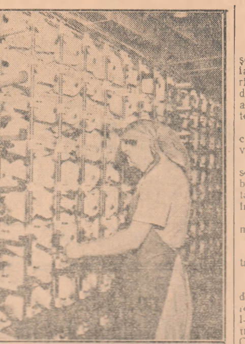
Colectivul uzinelor textile „Moldova” din Botosani, luptă pentru a da oamenilor muncii, cit mai multe țesături și fire de bună calitate.

GR. ANGELESCU correspondent „Scinteia tineretului” pentru regiunea Bîrlad