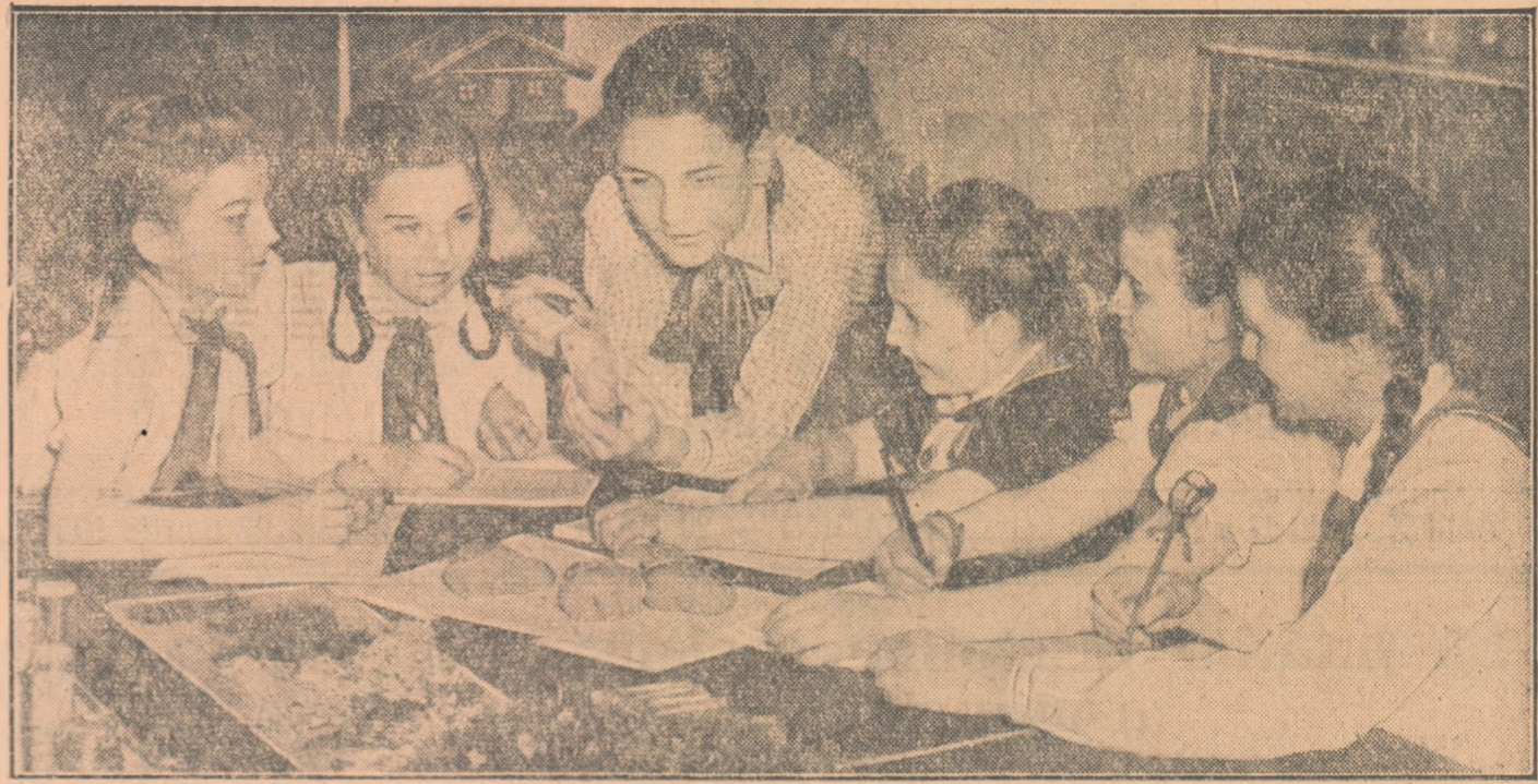
La casa pionierilor din orașul Sibiu, pionierii din cercul tinerilor muncitorilor discută activitatea. Odată cu primăvara ei și-au început studiile pe viu.