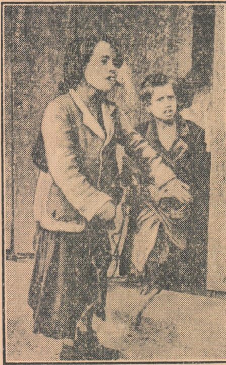
Un aspect obișnuit în Spania zilelor noastre: copii cerșind pe străzi. Pe chipul lor citești suferințele la care sint supuși de un regim străin de interesele celor mulți.

TIPARUL: Combinatul Poligrafic Casa Ștefiei „I. V. Stalin“ — Piața Ștefiei.