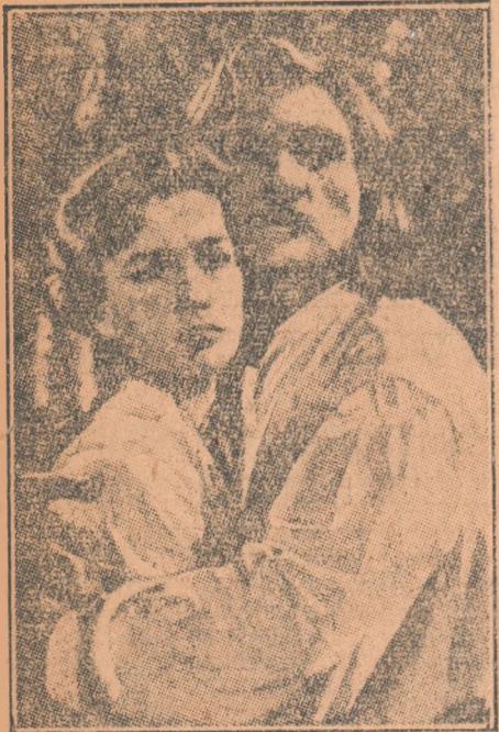
O scenă din filmul „Locotenentul lui Rakoczi“