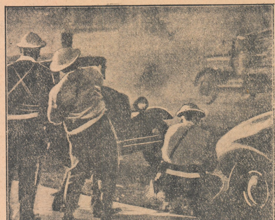
În timpul unei greve a muncitorilor de la rafinăria de petrol Ricnmona—Caltormia (S.U.A.) poliția a aruncat asupra pichetelor de greviști bombe lacrimogene, cauzînd împiedicarea desfășurării grevelor.

● Ministrul de externe britanic, Eden, a avut miercuri dimineața o întrevvedere cu vicecancelarul guvernului de la Bonn, Böhcher, care se găsește de luni la Londra. După cum precizează France Presse în cursul acestei întrevedere a fost discutată problema poziției Angliei față de comunitatea defensivă europeană.