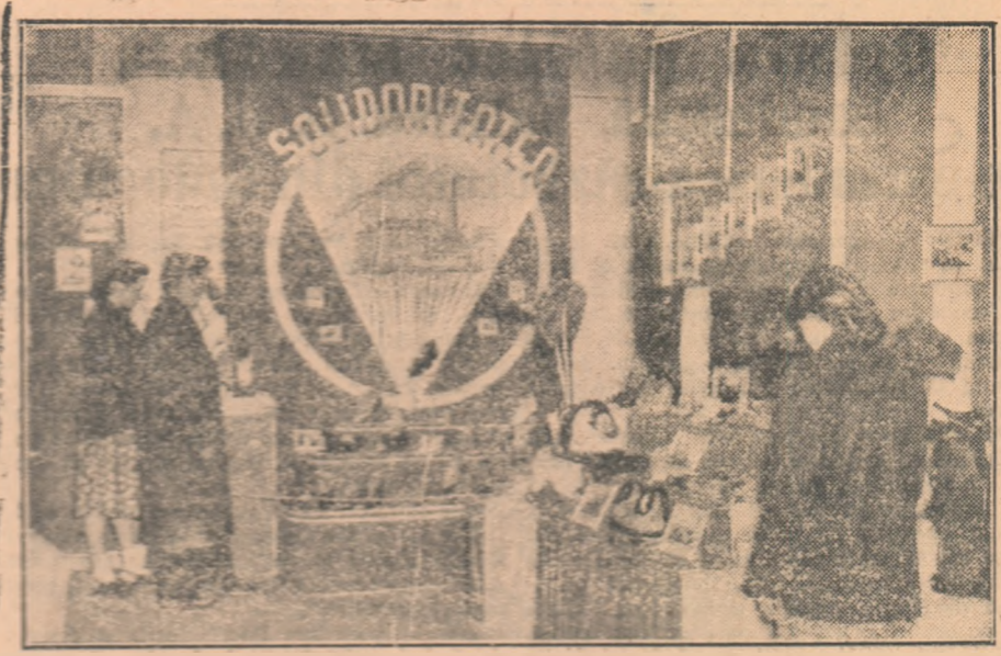
Pentru a cunoaște preferințele consumatorilor, întreprinderile producătoare de bunuri de larg consum organizează expoziții unde se pot vedea cele mai variate produse. Cunoașterea și studierea cerințelor consumatorilor ajută la îmbunătățirea sortimentelor produse. De cînd s-a deschis la Oradea o expoziție unde întreprinderile industriei ușoare din oraș au expus articole de larg consum pe care le produc.