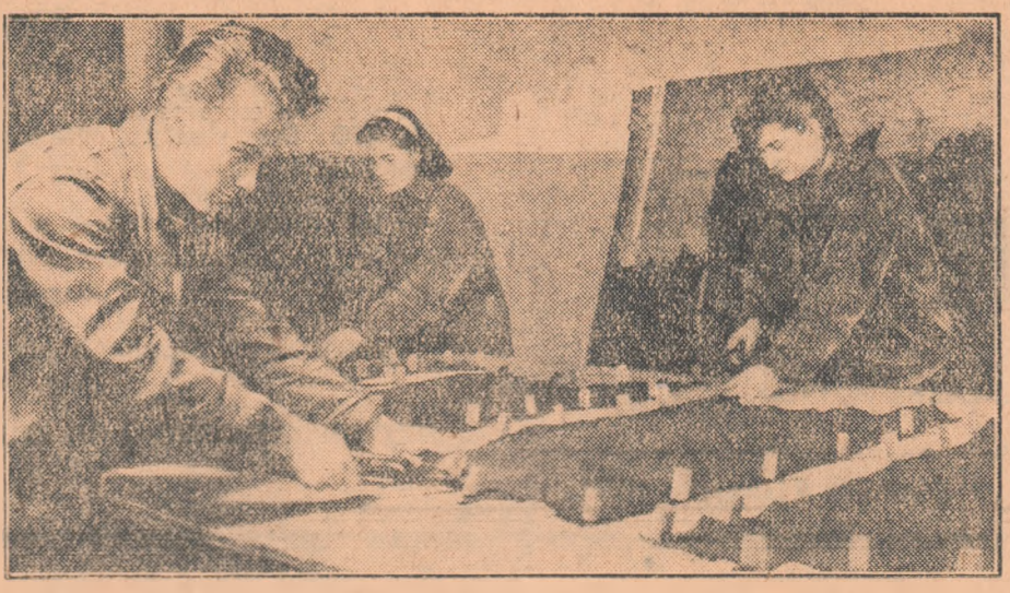
Elevii Școlii medii tehnice de pielărie și cauciu din București se pregătesc temeinic să devină bui tehnicieni.

Metoda atomilor marcați a ajutat la înțelegerea procesului de însușire a carbonului de către plante.