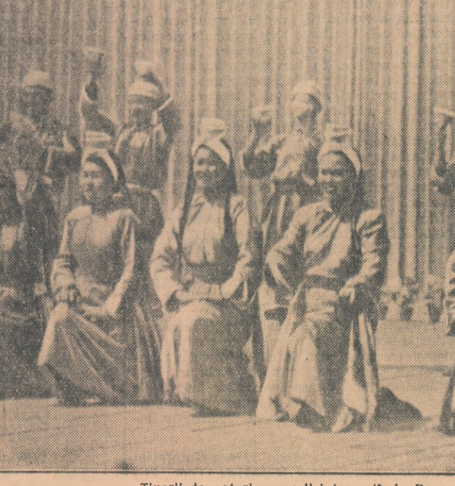
Tinerii dansatori mongoli interpretînd „Dansul cu cești” (cadru din film).