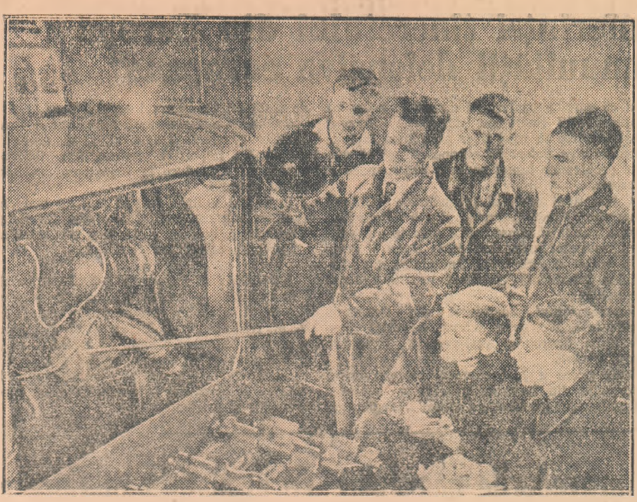
Mulți dintre elevii care termină anul acesta școala de 10 ani din satul siberian Altaișco au hotărît să lucreze la stațiunile de mașini și tractoare. Iată-l în timpul lecției, ascultînd cuvintele profesorului care le explica construcția tractorului.

Un rol deosebit în ridicarea calității învățămîntului în școlile profesionale l-au avut comitetele regionale ale cadrelor didactice