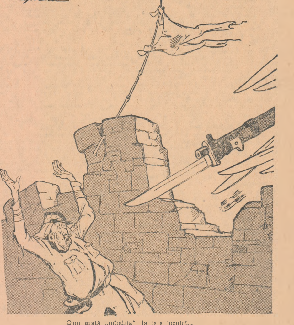
Cum arată „mîndria” la fața locului... Desen de EUG. TARU

Din ordinul de zi dat de generalul Navarre: „...apărarea Dien-Bien-Fu-ului a dat corpului expediționar... un nou motiv de mîndrie...”