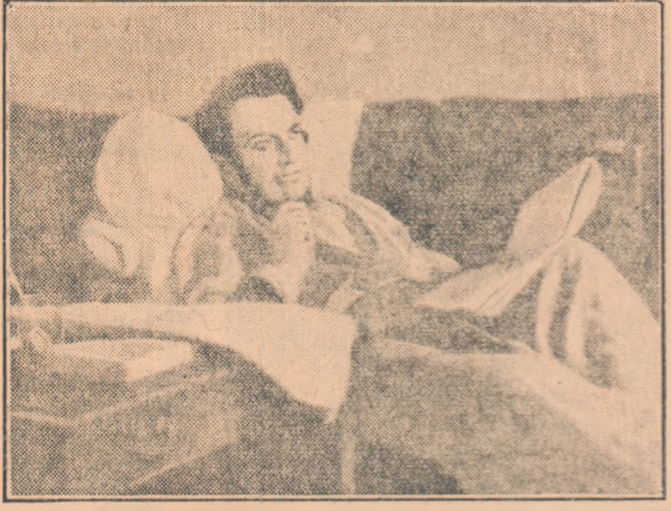
M. I. GLINKA în perioada creației operei „Ruslan și Ludmila”. Portret de pictorul I. E. Repin. Galeria de Stat Trețiacov-Moscova

Personalitatea muzicală a lui Glinka a apărut și s-a dezvoltat în prima jumătate a secolului trecut, atunci când în Rusia se afirmă cu putere forța poporului. Înfringerea trupelor cotronitoare napoleoniene la 1812, răscobala (jărănești), un accentuat spirit patriotic orinduriu nedrepte feudale, eoul mișcării protestatare a „decembristilor”, iată fondul social pe care s-a ridicat acest mare geniu muzical. Glinka s-a alăturat de tinar grupului de intelectuali democrați care militau pentru valorificarea și afirmarea culturii naționale ruse, în condițiile grele în care oligopoliticul vremii sfidau tot ce era rusesc, popular, înaintat.