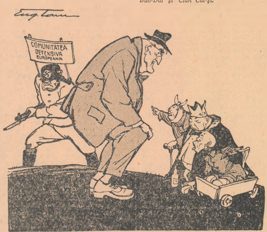
PIGMEII DOLARIZATI: — Nene Dulles, fă-ne și nouă o comunitate tot atât de densivă ca și cea europeană. Desen de EUG. TARU

GENEVA 1 (AGERPRES). — TASS transmite: La 1 iunie, ministrul afacerilor externe al U.R.S.S. V. M. Molotov, s-a înapoiat la Geneva, după o scurtă ședere la Moscova.