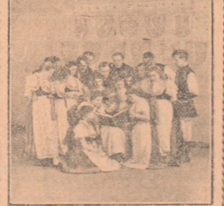
Ansamblul de dansuri al Casei de cultură din Opole.

Sub îndrumarea Partidului Muncitoresc Unit Polonez în Polonia democrație populară a crescut considerabil numărul școlilor de toată grațiozitatea, al teatrelor și cinematografeilor, căminelor culturale și bibliotecilor.