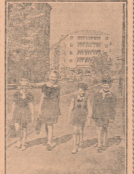
Clădirea de stare a bucuria acestor copii care pot să participe la activitatea culturală.