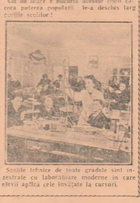
Secțiile tehnice de toate gradele sînt înzestrate cu laboratoare moderne în care elevii aplică cele învățate la cursuri.