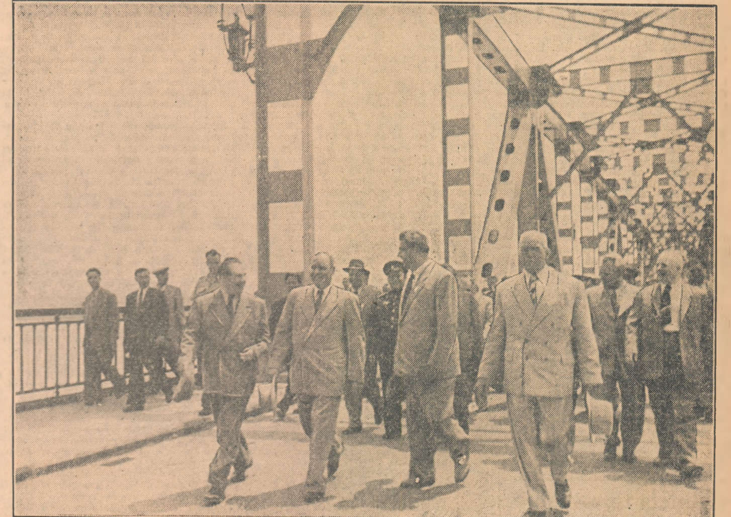
Aspecte de la solemnitatea inaugurării podului de peste Dunăre dintre Republica Populară Romîna și Republica Populară Bulgaria