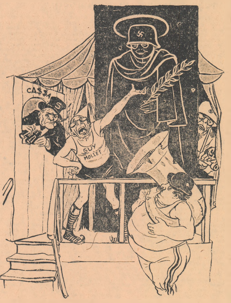
Guy Mollet: Senzațional, fenomenal, ce-i afară desen e înăuntru viu și natural! Cine nu crede să încerce!

Unii conducători socialiști de dreapta francezi în frunte cu Guy Mollet și-au asumat rolul de vocaționali „comunității defensive europene” încercînd să ascundă faptul că prin c.d.e. se urmărește renasțerea armatei naziste.