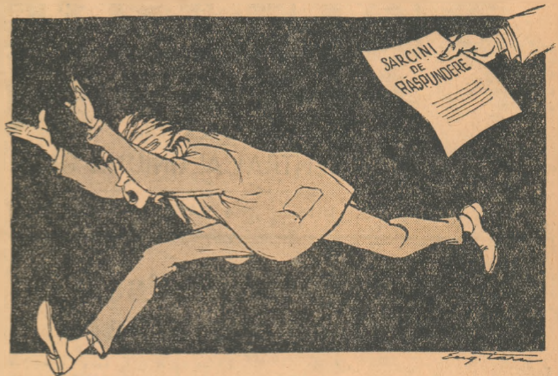
...fuga de răspundere