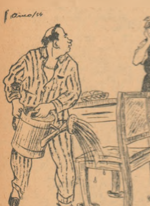
— Mai încerc și așa, Lenuțo, poate o mai salvezi citva timp... Desen de E. ARNO

Mobilă pusă în comerț de cooperativa meșteșugărească „Lemn și Mobilă” din Capitală, precum și de alte cooperative de acest gen, este necorespunzătoare, avînd un mare procent de umiditate, ceea ce face ca atunci cînd se usucă, mobilă să se curbeze și să crape în unele locuri.