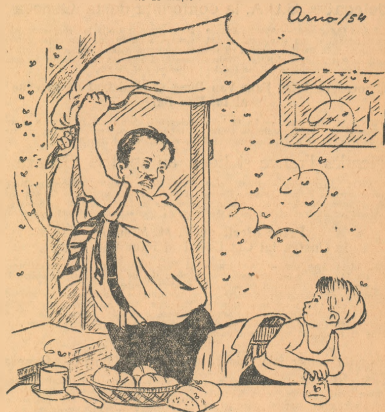
— Norocul nostru, tătucule, este că muștele apar numai vara. — Și ghinionul nostru e că „Hirtia de muște” dispare vara.

O. C. L. „Alimentara” nu se îngrijește să aprovizioneze vara toate unitățile cu cantități suficiente de „Hirtie de muște”.