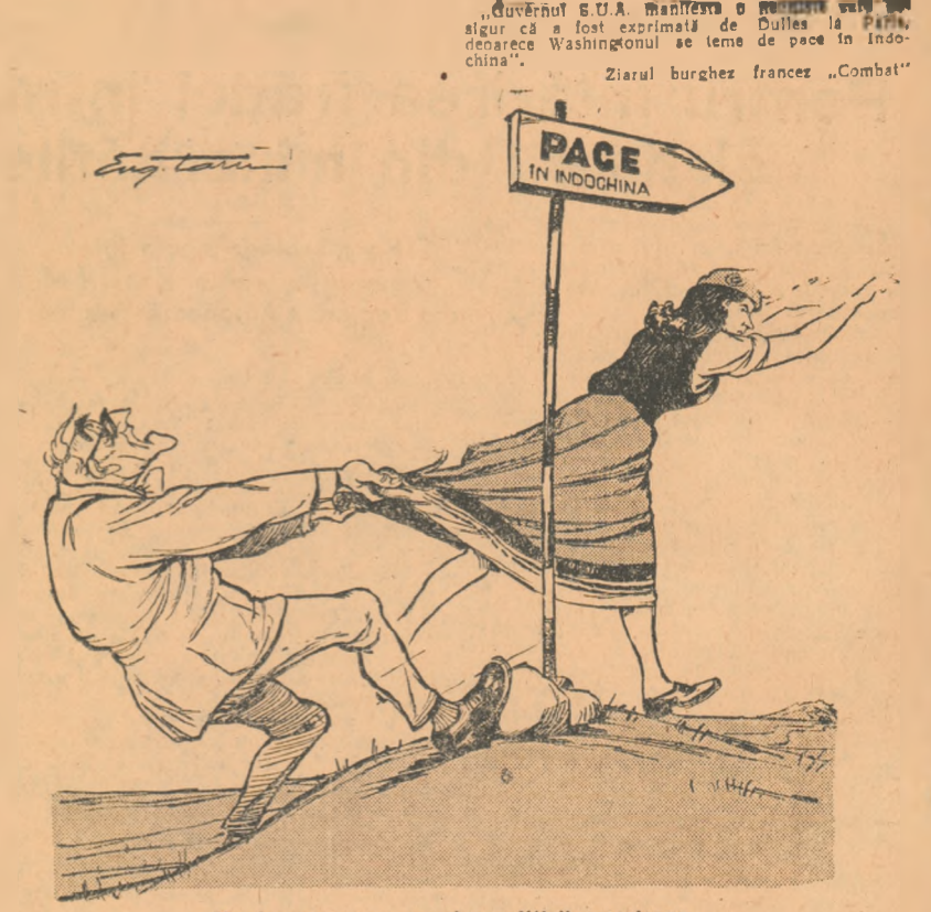
Un drum care nu convine politicii americane. Desen de EUG. TAZU

În R.P. Chineză se acordă o atenție deosebită pregătirii tinerilor scriitori. Zece de tineri din mine, uzine, fabrici sau din armata se pregătesc la Institutul de literatură de pe lângă Uniunea Scriitorilor pentru a deveni scriitori, sau critici, poeți sau dramaturgi. Nici cînd în Istoria Chinei, sălile de spec-