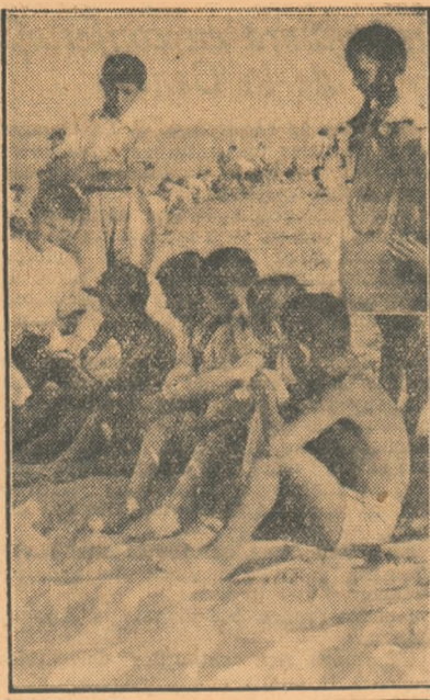
Tabăra de pionieri C.C.S. Vasile Roașă, găzduiește zilele acestea 420 pionieri veniți din toată țara.

Soarele de iulie e puternic, iar nisipul fin de pe plajă, frige. Dar pionierii din cercul „milionilor îndemnați” s-au obișnuit cu el. Unul dintre ei explică cum se construiește o corabie care să „reziste” valurilor furioase ale mării. E mică corabia... micii sînt și constructorii.