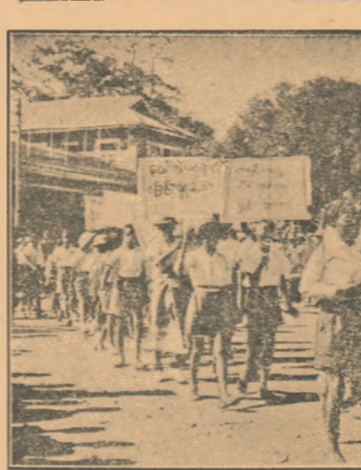
Poazele și tineretul din țările Asiei care nu cunosc încă adevărata libertate și care sînt victimea uneltor imperiaștilor cetrotiporilor, luptă cu însușirile pentru pace și independență națională.

În fotografie: o manifestație a tineretului din Birmania pentru pace, libertate și independență națională.