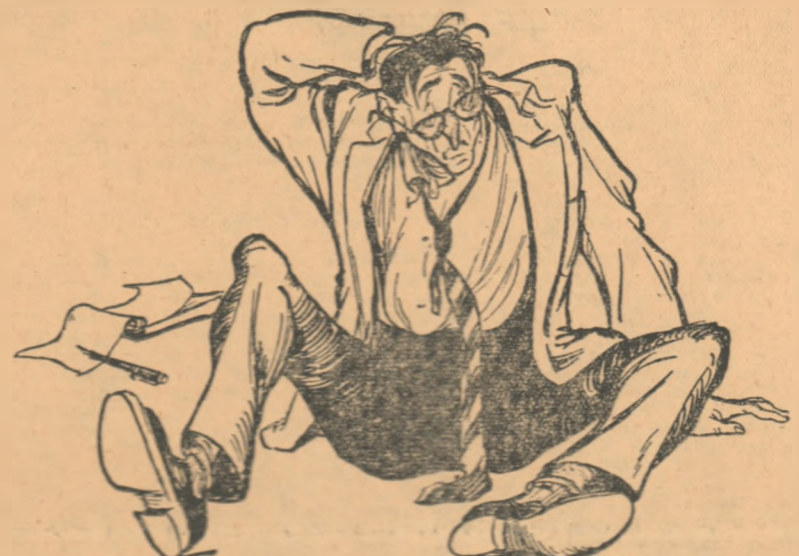
Desen de EUG. TARU

Obiectivitatea, cu mîinile ei de cîștigă- toare a înșelî Festivalului, trăgîndu-l de braț mai departe, îl sili apoi pe Claw- head să meargă la un cămin învecinat. Aici, pe același mult uzat clișeu, cu o