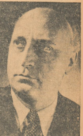
PAUL CONSTANTINESCU Compozitor pentru „Concertul pentru pian și orchestră” și „Tocata pentru pian”