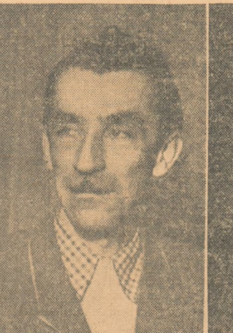
EUGEN JBELEANU Poet pentru poemul „Bălcescu”