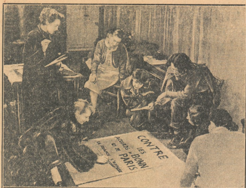
Fotografia de mai sus înfățișează un grup de tineri francezi care pregătesc un afiș: „IMPOTRIVA ACORDURILOR DE LA BONN și PARIS. FRANȚA SE OPUNE”. Lăpătat de ziduri sau purtate de mîini voioase și hotărîte, această chemare va strînge în jurul ei tot mai mulți tineri patrioți. După încetarea focului în Indochina, tineretul francez continuă lupta cu același elan împotriva „comunității defensive europene”.