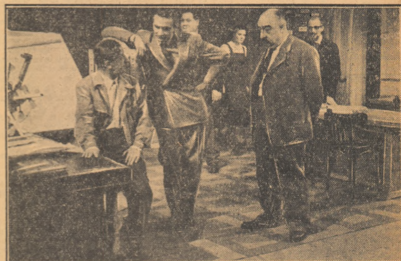
În cadrul decadelor manifestărilor culturale, se va juca astăzi piesa „Mielul Turbat” de Aurel Baranga.