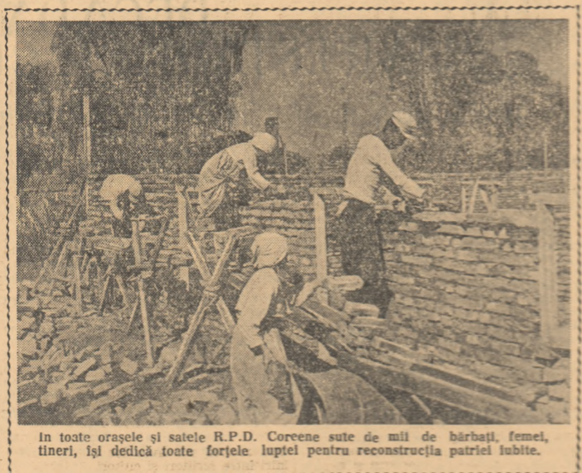
În toate orașele și satele R.P.D. Coreene sute de mii de bărbați, femei, tineri, își dedică toate forțele luptei pentru reconstrucția patriei iubite.

Poporul român care nutrește sentimente frățesti, de dragoste față de poporul coreean de care lăgheza lupta comună pentru apărarea păcii și viitorului fericit, îi urează cu prilejul celei de a 9-a aniversări a eliberării patriei succes deplin în opera de reconstrucție a țării, în lupta pentru restabilirea unității patriei sale.