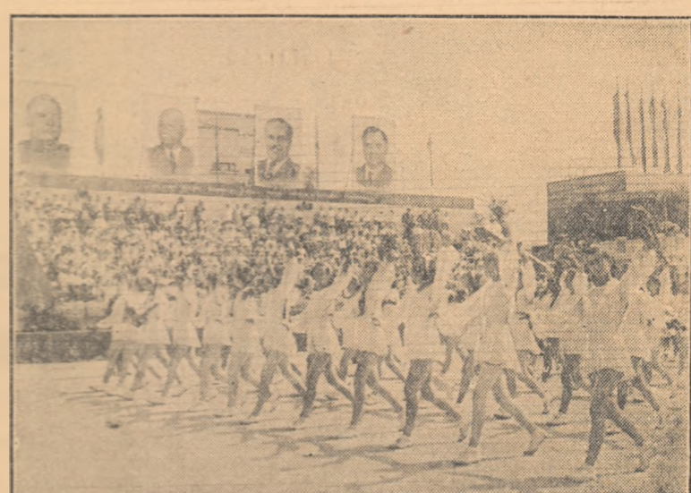
De neuitat vor rămîne clipele uriașei demonstrații care a avut loc în Capitală cu prilejul zilei de 23 August. Militarii forțelor noastre armate au sîrînit entuziasm datorită înfetei impecabile în care au defilat.