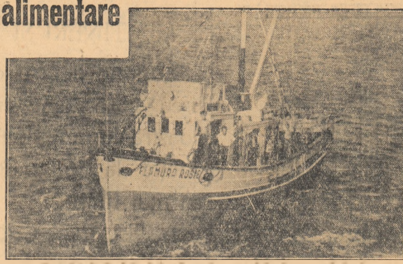
Viața pescarilor în anul puterii populare a devenit înfloritoare. Locul bărcilor — care se scufundau la fiecare furtună — l-au luat pescadourile motorizate și alte ambarcațiuni motorizate ale flotei pescărești.

In fotografie, pescadorul motorizat „Flamura Roșie“ sosește la vasul-bază pentru a descărca peștele.