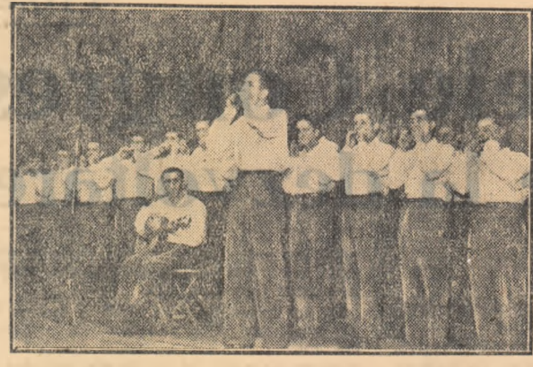
Orchestra de muzicuțe a Trustului 18 Instalații electrice și ascensoare.