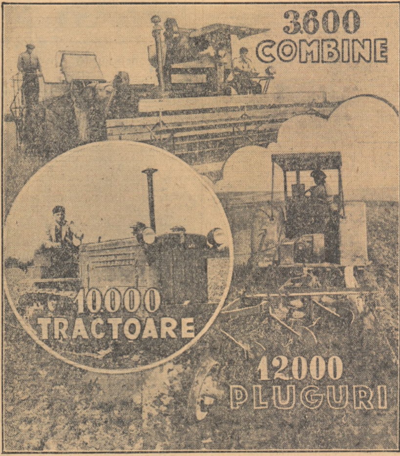
Proiectul de Directive al Congresului al II-lea al Partidului cu privire la dezvoltarea agriculturii în următorii 2-3 ani dă mari perspective de dezvoltare a mecanizării în agricultură. Mărirea acestui fapt sînt cifrele grătore din graficul de față. În anul 1955-1956, din producția internă și din importuri 10.000 tractoare, 12.000 pluguri de tractoare, 6.000 cultivatoare, 5.500 mașini de semănt și plantat, 1.450 cositori autopropulsate și tractate, 3.200 secerători-legători, 3.600 combine etc.

Ne propunem de asemenea să menținem spiritul de întrecere în rîndurile tractoriștilor, pentru terminarea cu succes a arăturilor și însămînțărilor de toamnă.