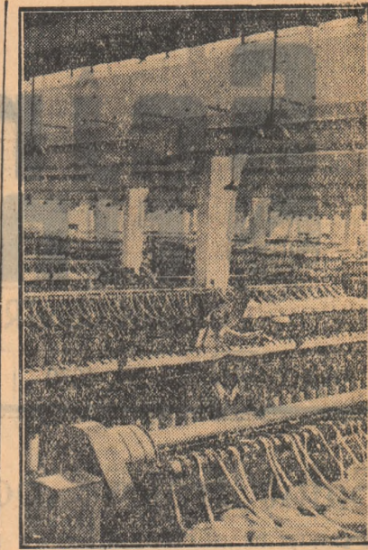
În anul regimului de democrație populară industria ușoară din țara noastră cunoaște o puternică dezvoltare. Înzestrarea fabricilor cu mașini moderne, crearea de uzine și fabrici noi este o mărturie a succeselor obținute pe acest tărîm. În fotografia noastră: Secția Flayere a uzinelor textile „Moldova” din Botoșani, uzină ridicată din temelii în anul regimului de democrație populară.