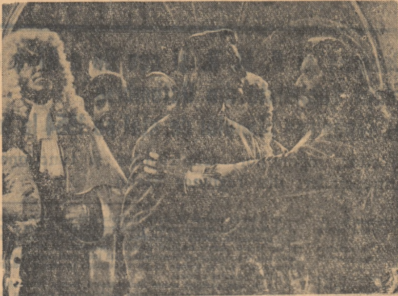
O scenă din film

Filmul „Locotenentul lui Rakoczi” își propune să înfățișeze — prin povestirea vieții unor oameni simpli — vitejia, dragostea de patrie și de libertate, optimismul și voia bună a poporului maghiar. Această idee centreată în jurul său toate episoadele principale ale scenariului literar scris de Barbas Tibor. Printr-o pricepută țesătură a intrigii, printr-un dialog concis, plin de poezie, care abundă în replici spirituale, inspirate din umorul sănătos popular, scenariul se remarcă și în cadrul filmului. Scenariul se remarcă și în cadrul filmului și în același timp prin varietatea acțiunii, care se desfășoară pe două planuri: pe timpul de luptă și în satul frumoasei Ana, iubita viteazului Ianoș Bornemissa. Acesta este un fost lăbăg, soldat simplu în armata de eliberare a prințului Rakoczi, care pe la începutul secolului al XVIII-lea conducea luptele celor mulți împotriva asuprii habsburgice. Prin eroismul de care dă dovadă, Ianoș câștigă simpatia tovarășilor săi de luptă și prețuirea comandantilor care îl avansează în lupta la gradul de sergent și apoi, în urma capturării șefului armatei dușmane, la gradul de locotenent.