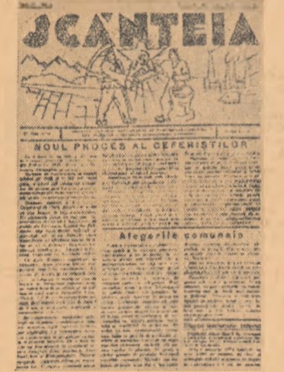
Facsimilul unei „Scînteii” ilegale

Tara Sovietică se mîndrește pe drept cuvînt cu flota sa aeriană. Încă înainte de Marele Război pentru Apărarea Patriei, U.R.S.S. s-a situat pe primul loc din lume în ce privește întinderea liniilor aeriene și traficul de mărfuri al transporturilor aeriene. În prezent lungimea totală a liniilor aeriene depășește 200.000 km. Transporturile aeriene dau un uriaș cîștig de timp. Distanța de la Moscova la Habarovsk, de pildă, pe care trenul accelerațor o parcurge aproximativ în zece zile, avionul o străbate în 28 de ore.