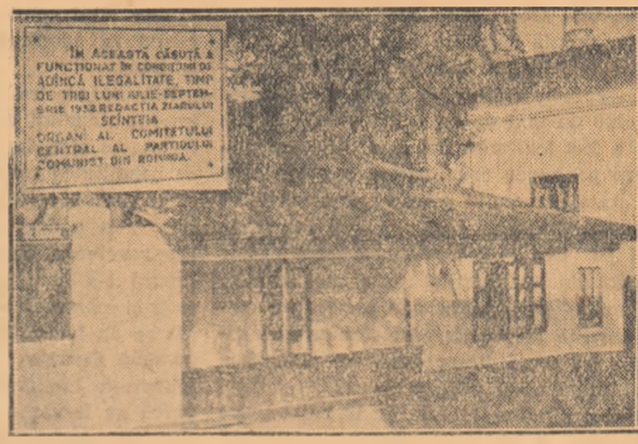
Casa din str. Ecoului 29 în care a funcționat o redacție ilegală a „Scînteii”