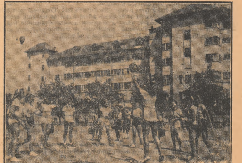
În curtea Școlii medii de 10 ani nr. 12 fete din București, elevice, așa precum puteți vedea în fotografia noastră, joacă volei în timpul orei libere. Ele se pregătesc intens pentru vîltoarele meciuri pe care le vor susținea.

O însemnată cantitate de produse a fost valorificată prin cooperatie. Peste 54.134 kg. castraveți au fost vîndute unor instituții, contribuind astfel la o mai bună aprovizionare a oamenilor muncii cu legume proaspete. Veniturile gospodăriei agricole colective cresc mereu și odată cu ele crește și bunăstarea colectivității.