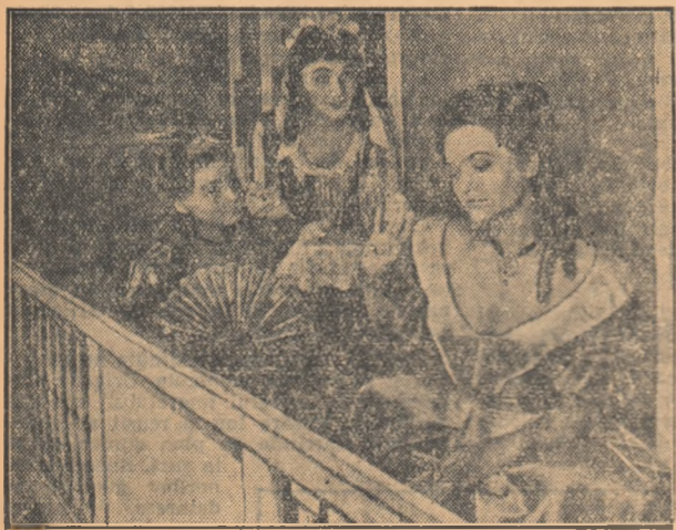
Studioul actorului de film „C. I. Nottara” și-a deschis recent stagiunea, prezentînd în premieră comedia „Mincinosul” de Carlo Goldoni, spectacol din care o scenă e reproducă în fotografia noastră.

OPERE INSPIRATE DIN TRECUTUL DE LUPĂ AL PARTIDULUI