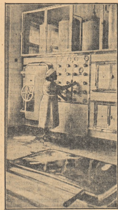
Noua sală de sterilizare a spitalului unificat nr. 9 „Prof. Dr. Marinescu”, din București.

Korceaghin nu numai că nu poate fi încadrat în această schemă născocită a „omului viu” dar îl este opus prin întreaga sa structură. Korceaghin este un om întreg. Îl este străină orice dublare: nicielieri, niciodată, în nici un fel de