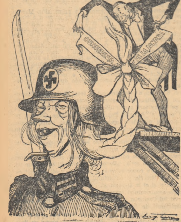
La Locrna se desfășoară conferința ministrilor de externe ai S.U.A., Angliei, Franței, Germaniei occidentale, Italiei, Belgia, Olanda, Luxemburg și Canada a vînd drept scop găsirea de noi soluții pentru înarmarea Germaniei occidentale în urma eșecului c.d.e.

În comunicatul final dat publicității după ședințele din după amiaza zilei de 28 septembrie a conferinței de la Londra, se anunță că în ședința restrînsă s-a hotărît crearea unei comisii care să studieze problema acordării „suveranității” Germaniei occidentale.