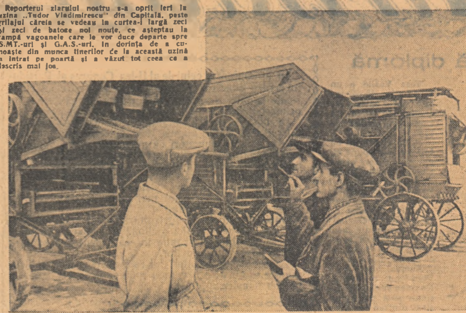
Reporterul ziarului nostru s-a oprit ieri la uzina „Tudor Vladimirescu” din Capitală, peste grădina căreia se vedeau la cerul larg zeci și zeci de batoze noi noue, ce așteptau la rampă vagoanele care le vor duce departe spre S.M.T.-uri și G.A.S.-uri, în dorința de a cunoaște din muncă tinerii de la această uzină a intrat pe poartă și a văzut tot ceea ce a descris mai jos.