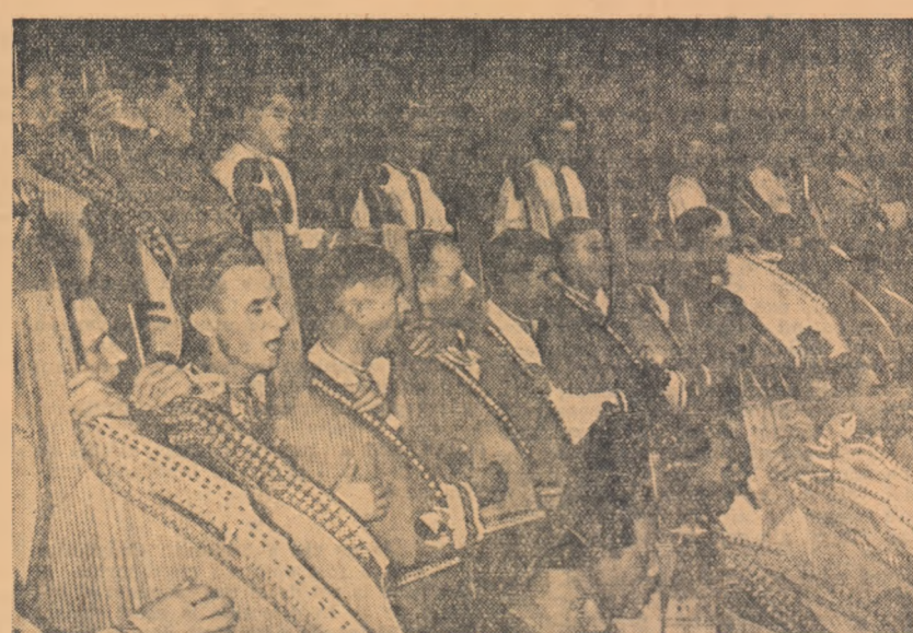
Solii minunatele arte sovietice se află din nou printre noi. Capela emerită de stat de banduriști din R.S.S. Ucraineană — pe care o vedeți în fotografie — se află în țara noastră, unde prezintă o serie de spectacole, cu prilejul Lunii Prieteniei Romino-Sovietice. (Foto: Agerpres)

Încă din primele ore după deschidere, bazarul a cunoscut o mare afliuență de public. (Agerpres).