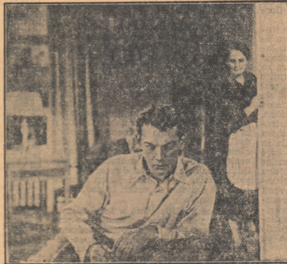
O scenă din film

Iată-l de pildă pe simpaticul Iurka: el își face socoteala că pentru examen va învăța numai întrebarea nr. 13... Se va duce la examen, va lua un билет, se va uita la el, apoi îl va arunca repede printre celelalte. Va spune profes-