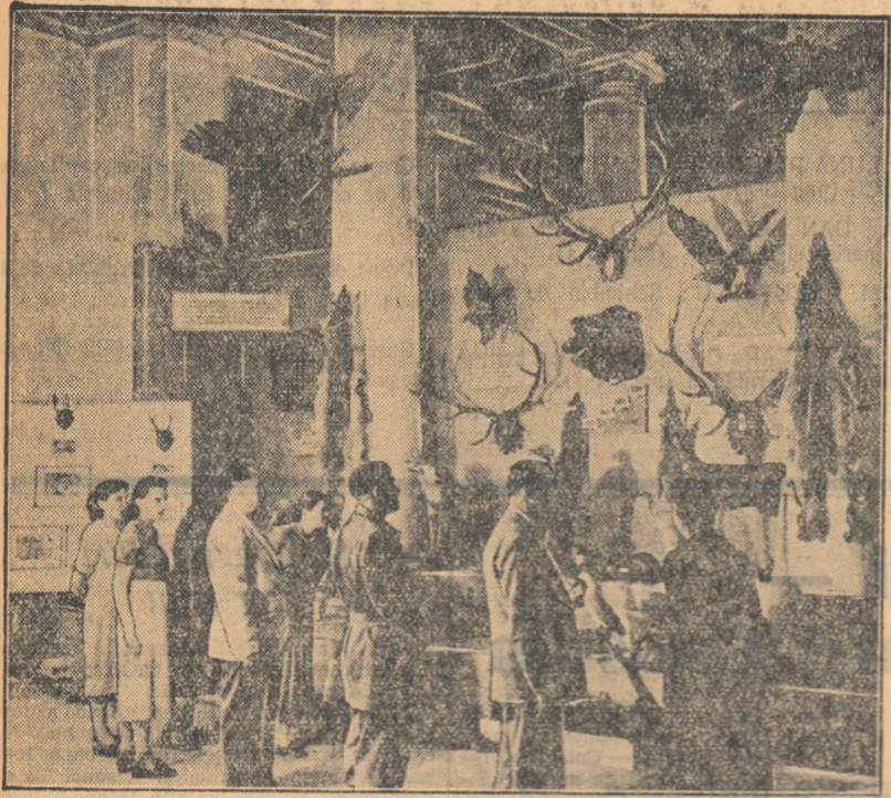
În diferite orașe din țară s-au deschis expoziții agricole care înfățișează aspecte din realizările obținute de cei ce muncesc pe ogoare în lupta pentru dezvoltarea continuă a agriculturii noastre. În fotografie: un colț al Expoziției Agricole Regionale din Ploiești. Vizitatorii privesc cu interes sectorul viticelăresc.