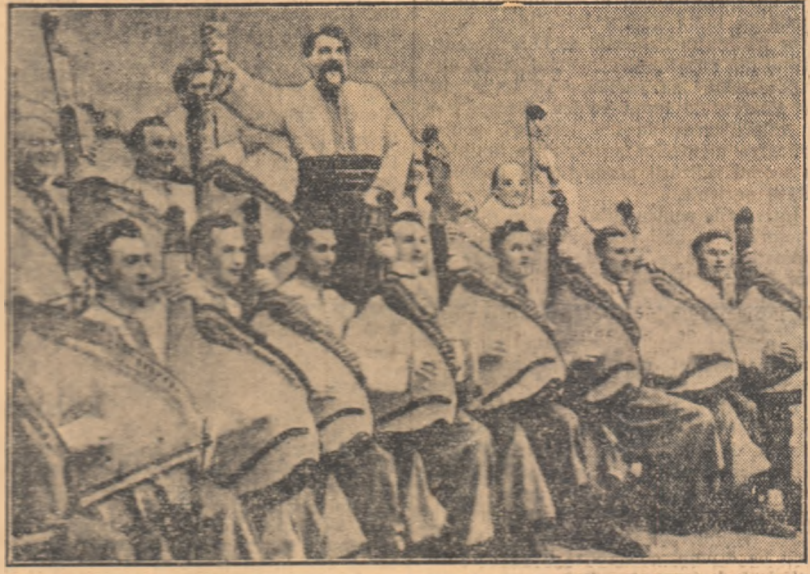
Din diferite colțuri ale țării ne-au sosit vești despre bucuria și entuziasmul cu care oamenii muncii au primit spectacolele membrilor Capellei emerite de stat de banduriști din R.S.S. Ucraineană. Artă lor vie și atât de optimistă a avut darul să sublinieze atmosfera sărbătorească în care se desfășoară Luna Prieteniei Romino-Sovietice. După un turneu prin țară plin de succes, artiștii sovietici s-au întors la București unde vor mai da o serie de spectacole. Cîșleul nostru înfrățește un grup de banduriști în timpul unui spectacol.

Interpretarea lucrărilor românești „Hai la vie” și „Cobzar bătrîn” m-au impresionat nespus de mult, așa cum dealtă la impresiunea pe toți ascultătorii din țara noastră. Aceste cîntece interpretate cu mare autenticitate, au exprimat atenția și dragostea oamenilor sovietici pentru poporul nostru. Vechea și atât de mult cîntată romanță „Cobzar bătrîn” a fost reînviată de Capela emerită de stat de banduriști din R.S.S. Ucraineană care l-au redat o strălucire de nelăchput. Ovațiile nesfîrșite ale publicului auditor confirmă din plin acest adevăr. „Pentru mine — a spus în încheiere maestrul Sabin Drăgoi — frumusețea cîntecelor ucrainene este de mult cunoscută. Aveam 10 ani cînd, aflîndu-mă în Ucraina, am făcut prima mea culesgere folclorică: 12 cîntece populare ucrainene, pe care le-am adunat de la o țărancă din regiunea Lvovului. De multe ori, atunci, înserările mi-au fost fermecate de răscăltarea frumusețe a melodiei populare ucrainene. De aceea, concerte ale Capellei de banduriști au însemnat pentru mine nu o surpriză, ci o reăgărire a unor vechi prieteni într-o viață nouă, plină de bucurii.