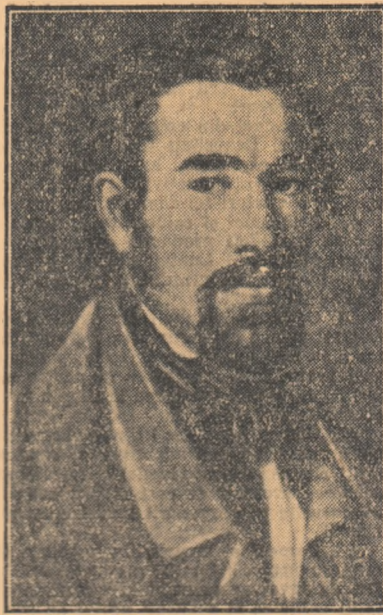
Portret de BARBU ISCOVESCU