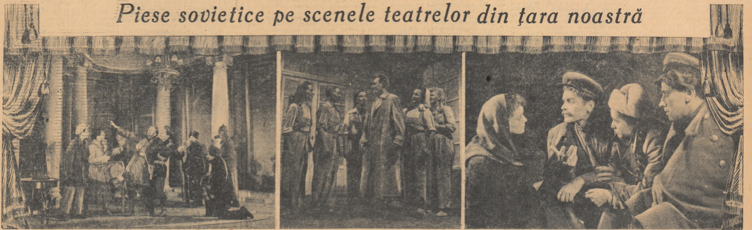
Teatrele din întreaga țară prezintă în aceste zile cu prilejul Săptămîni teatrului sovietic lucrări dintre cele mai valoroase ale dramaturgiei clasice ruse și sovietice.