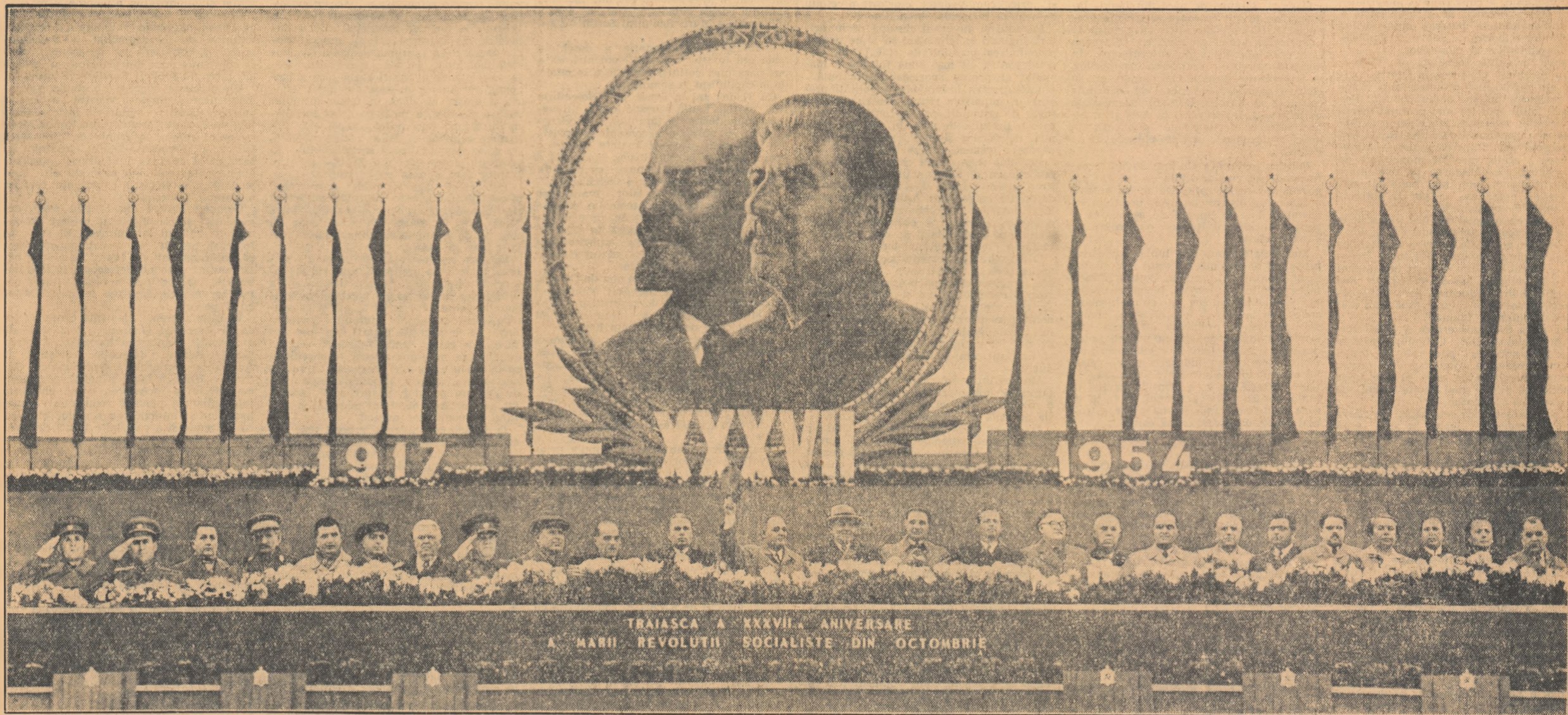
Un aspect al tribunei din piața „I. V. Stalin” în timpul mitingului oamenilor muncii din Capitală