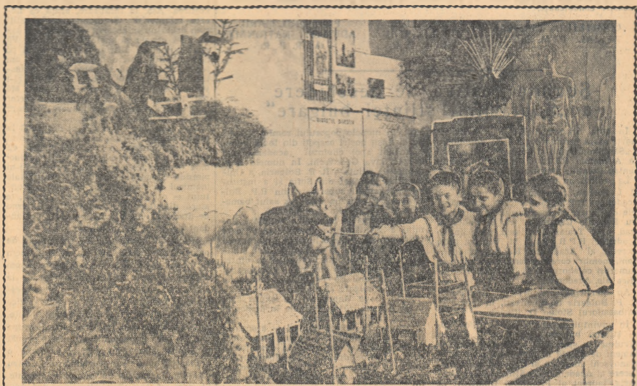
Să vezi cu ochii tăi animalele, insectele și plantele despre care îți se explică în orele de Științele naturale, sau citești în manuale, este un ajutor prețios în însușirea mai temeinică a cunoștințelor.