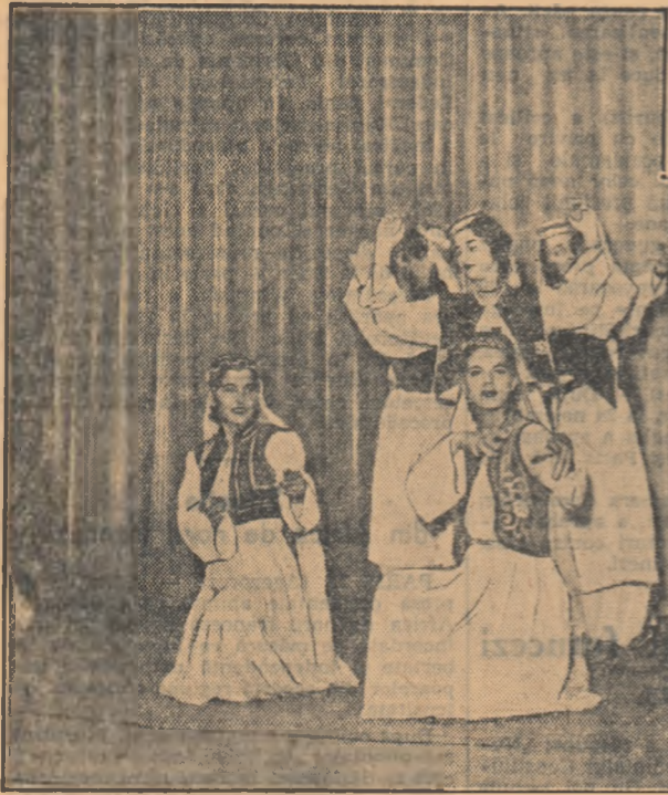
În țara noastră, este deopotrivă cinstită și apreciată cultura diferitelor minorități naționale. Ea își găsește, datorită politicii înțelepte a partidului nostru în problema națională, posibilități largi de dezvoltare. Iată, în fotografie, echipa de dansuri țărăne a unui cîmîn cultural sîntesc din Tulcea cu prilejul unui festival dat în sala C.C.S. din Capitală.