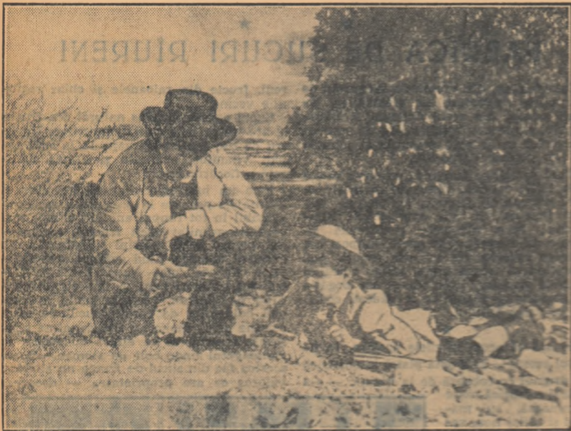
O scenă din filmul 'Cercul Slavia'