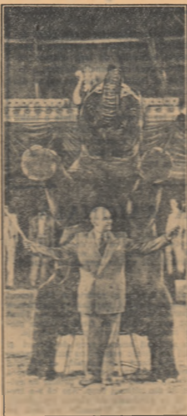
O scenă din filmul 'Profesorul Fabre'