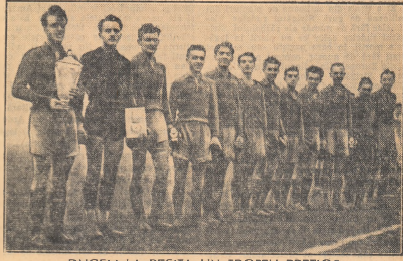
DUCEM LA REȘITA UN TROFEU PREȚIOS

Sintem fericiți că echipa noastră a reușit o asemenea performanță la capătul unui drum greu, plin de obstacole. Intr-adevăr, sîm terminat învingători la București și mai ales împotriva echipei „Dinamo”, iată un lucru pe care mulți dintre noi nu-l credeau posibil. Duceam la Reșița un trofeu pentru care am luptat mult, neprecupețind nici un efort.